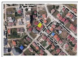
INCADRARE IN ZONA